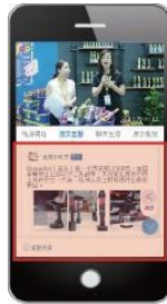
图文直播 (展会摊位照片 + 文字)