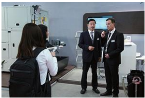
展位采访及拍摄 (专业摄影团队提供支持)