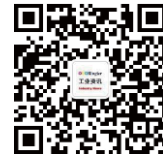
关注荣格工业传媒微信号, 获得更多工业、荣格活动信息