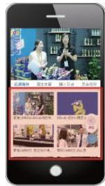
5分钟以内短视频 (产品介绍 + 采访)