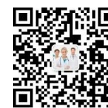
荣格医疗器械资讯