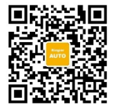
荣格汽车制造行业微信号