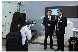
展位采访及拍摄 (专业摄影团队提供支持)