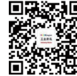
关注荣格工业传媒微信号，获得更多工业、荣格活动信息