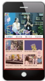
5分钟以内短视频 (产品介绍+采访)