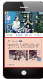
图文直播 (展会摊位照片+文字)