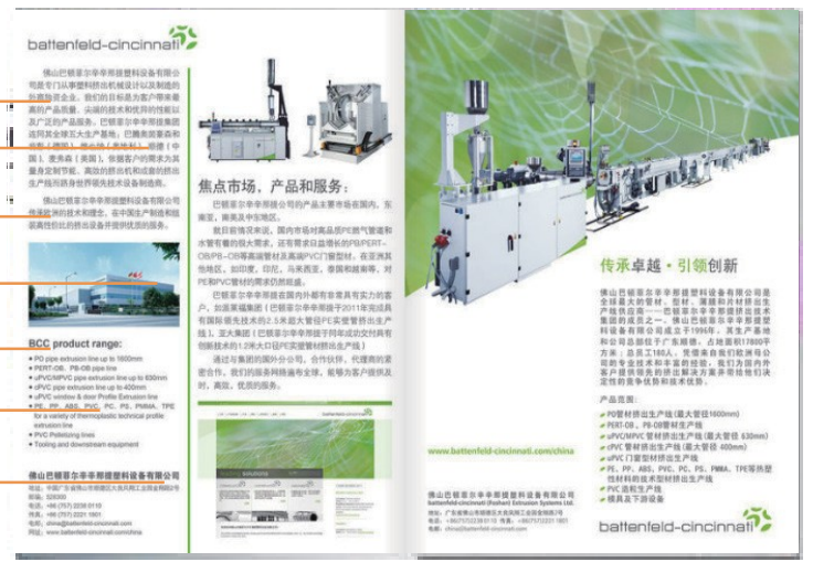
企业风采展示页 1 页全彩广告页