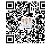
荣格医疗器械资讯行业微信号