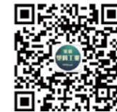
荣格塑料工业行业微信号