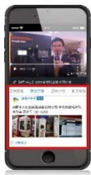
图文直播 (展位照片+文字)