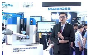
展位采访及拍摄 (专业摄影团队提供支持)