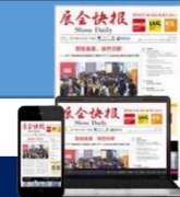
2020官方展会快报价格 (RMB)