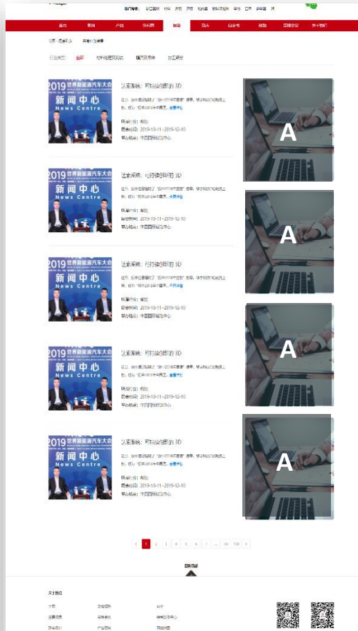
展会列表页 (中文及英文网站)