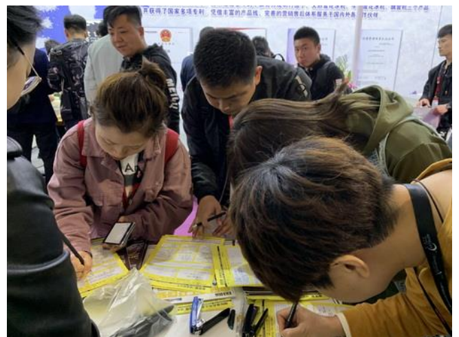
行业参观者在荣格展位免费获取杂志

在我国不断推行的“碳中和”“碳达峰”目标下，传统食品饮料工业高能耗、低效率的工业模式，亟需得到技术突破。因此，从食品和饮料供应链的各个阶段，企业都在努力减少他们的碳足迹。2021年及以后，环保和可持续包装的趋势将更为明显，许多食品饮料公司开始使用可回收或生物降解，甚至可食用的包装材料，植物基塑料包装或生物塑料将进一步增长。